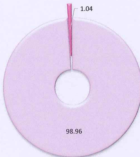
แผนภูมิที่ ๑ แสดงร้อยละจำนวนโครงการจำแนกตามวิธีการจัดซื้อจัดจ้าง ปีงบประมาณ ๒๕๖๖

พบว่าปีงบประมาณ ๒๕๖๖ งานพัสดุ โรงพยาบาลบ่อทอง ได้ดำเนินการจัดซื้อจัดจ้าง จำนวนทั้งสิ้น ๖๖๗ โครงการ มีวิธีการในการจัดซื้อจัดจ้าง ๒ วิธี คือ วิธีเฉพาะเจาะจง และ วิธีประกวดราคาอิเล็กทรอนิกส์ (e-bidding) โดยวิธีการจัดซื้อจัดจ้างมากที่สุดคือ วิธีเฉพาะเจาะจง คิดเป็นร้อยละ ๙๘.๗๑