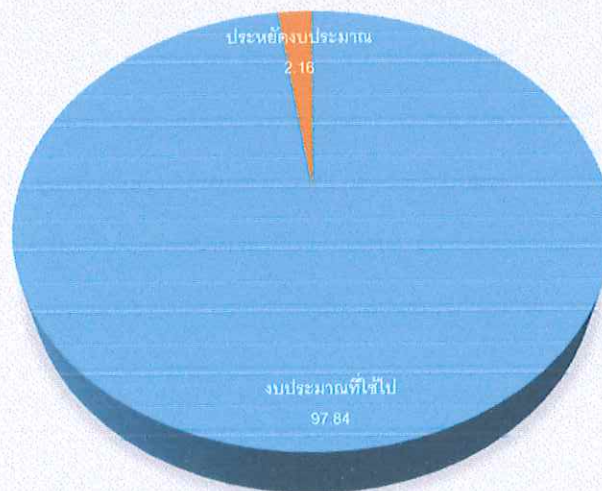
แผนภูมิที่ 3 แสดงการใช้งบประมาณ (งบค่าเสื่อม) ปีงบประมาณ 2568

จากการดำเนินการจัดซื้อจัดจ้าง งบค่าเสื่อม ปีงบประมาณ 2568 ได้ดำเนินการจัดซื้อจัดจ้าง โดยกำหนดวิธีการแยกตามวงเงินในรายการที่ได้รับจัดสรร 2 วิธี คือ วิธีเฉพาะเจาะจงและวิธีประกวดราคาอิเล็กทรอนิกส์ ( e-bidding) ซึ่งโรงพยาบาลบ่อทองได้รับจัดสรรงบประมาณ งบค่าบริการทางการแพทย์ที่เบิกจ่ายในลักษณะงบลงทุน (งบค่าเสื่อม) ประจำปีงบประมาณ 2568 จำนวนเงิน 2,489,100.00 บาท จัดหาพัสดุได้ในเป็นจำนวนเงิน 2,435,285.00 บาท คิดเป็นร้อยละ 97.84 และประหยัดได้เป็นจำนวนเงิน 53,815.00 บาท คิดเป็นร้อยละ 2.16